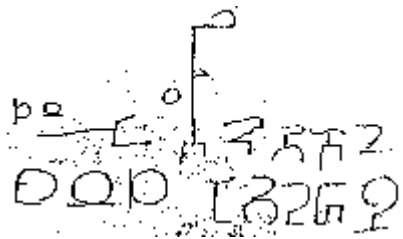
(S97-3.gif - n'est lisible que sur Aguirre, page II-II-81)